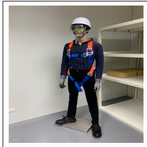
穿戴全身背負式安全帶之假人