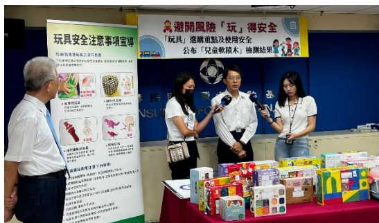
保障兒童「玩」的安全 「玩具」選購重點及使用安全