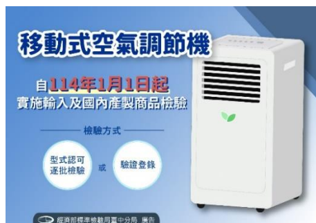
移動式空氣調節機 自114年起 實施輸入及國內產製商品檢驗