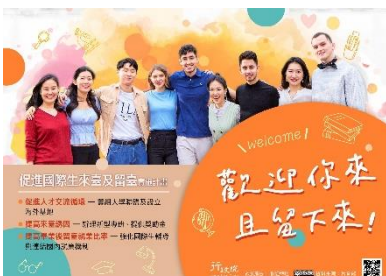
促進國際生來臺 留臺實施計畫