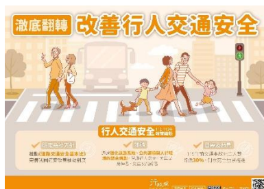
行人交通安全 政策綱領