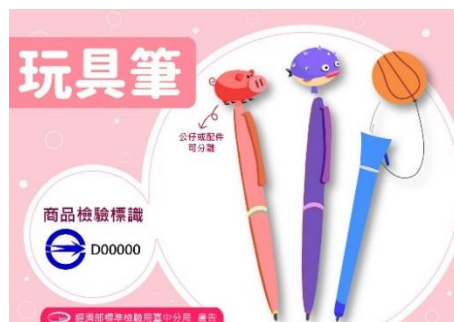
選購「玩具筆」時，應購買有 貼附「商品檢驗標識」之商品