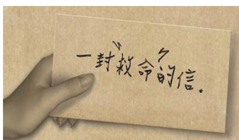
防制人口販運— 一封救命的信