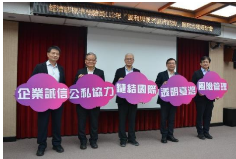
「圖利與便民區辨諮詢」 廉政治理研討會