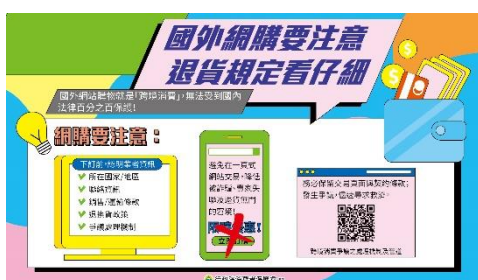
境外消費糾紛難解 交易前請審慎評估