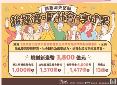
通過《疫後強化經濟與社會韌性及全民共享經濟成果特別條例》