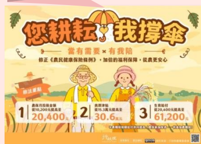
修正《農民健康保險條例》