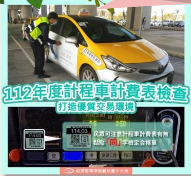
112年度計程車計費表檢查 打造優質交易環境