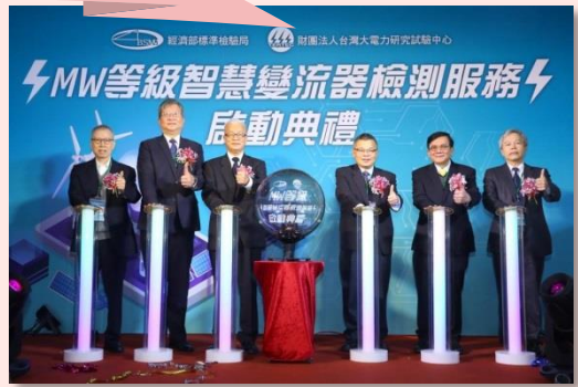
啟動MW等級智慧變流器 檢測服務