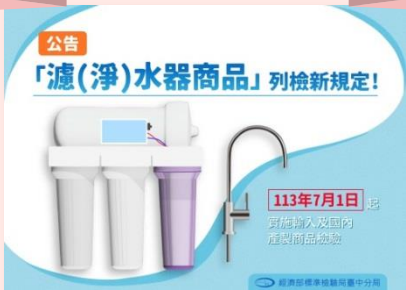
公告「濾(淨)水器商品」 列檢新規定!