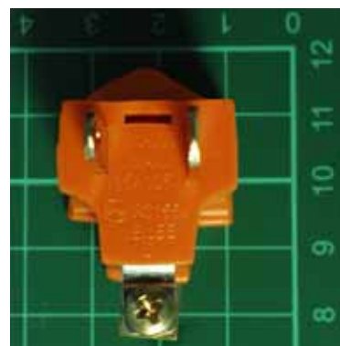
圖2（接地端點位於轉接器下方）