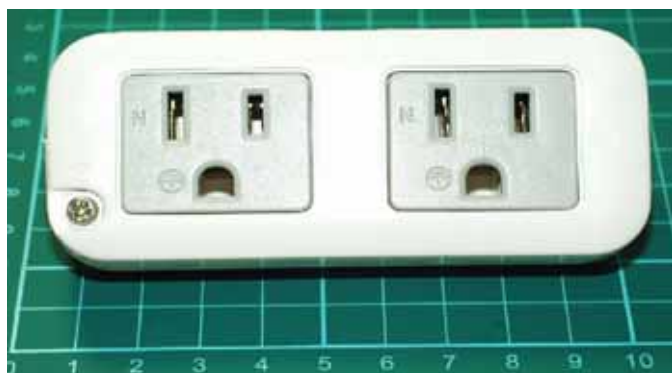
圖3 (接地端點位於插座正面)