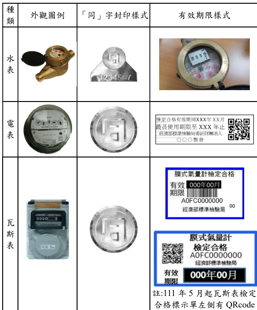
圖 2 家用三表「同」字封印及有效期限的樣式

掛表使用，民眾也能用得安心。經過檢定合格的家用三表，會附加專屬的「同」字封印及有效期限標示，以供民眾辨別。家用三表「同」字封印及有效期限標示的樣式如圖 2。