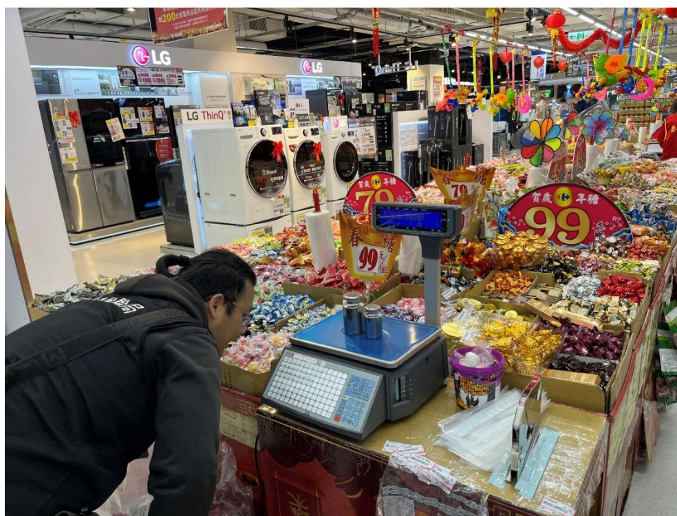
▲1130108 家樂福淡新店 磅秤檢查