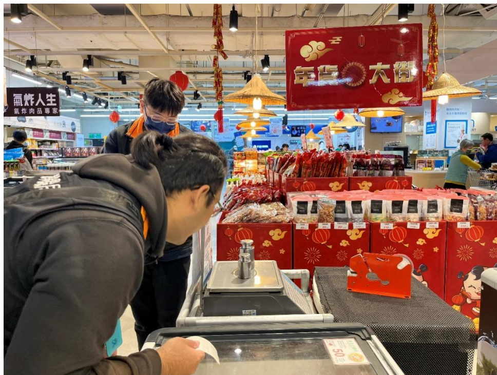
▲1130108 家樂福淡新店 磅秤檢查