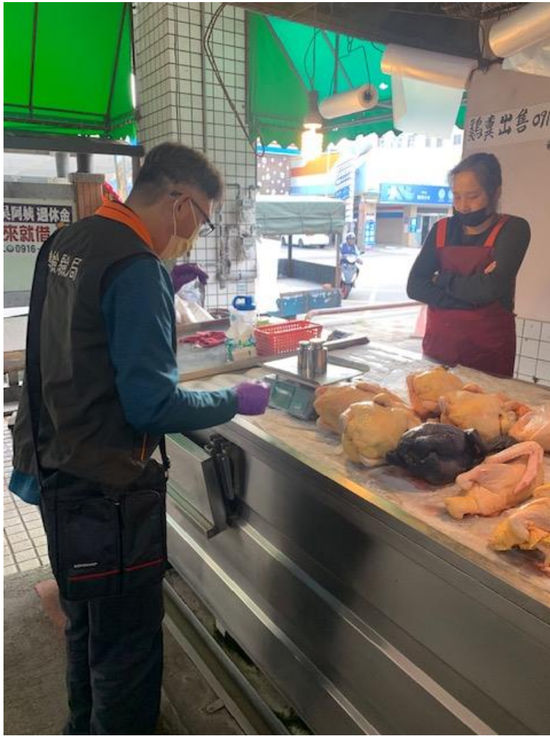
▲1130105 北苗公有零售市場 雞肉攤電子秤檢查